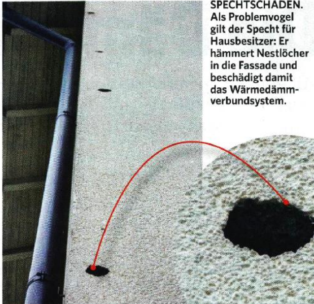
SPECHTSCHADEN. Als Problemvogel gilt der Specht für Hausbesitzer: Er hämmert Nestlöcher in die Fassade und beschädigt damit das Wärmedämmverbundsystem.